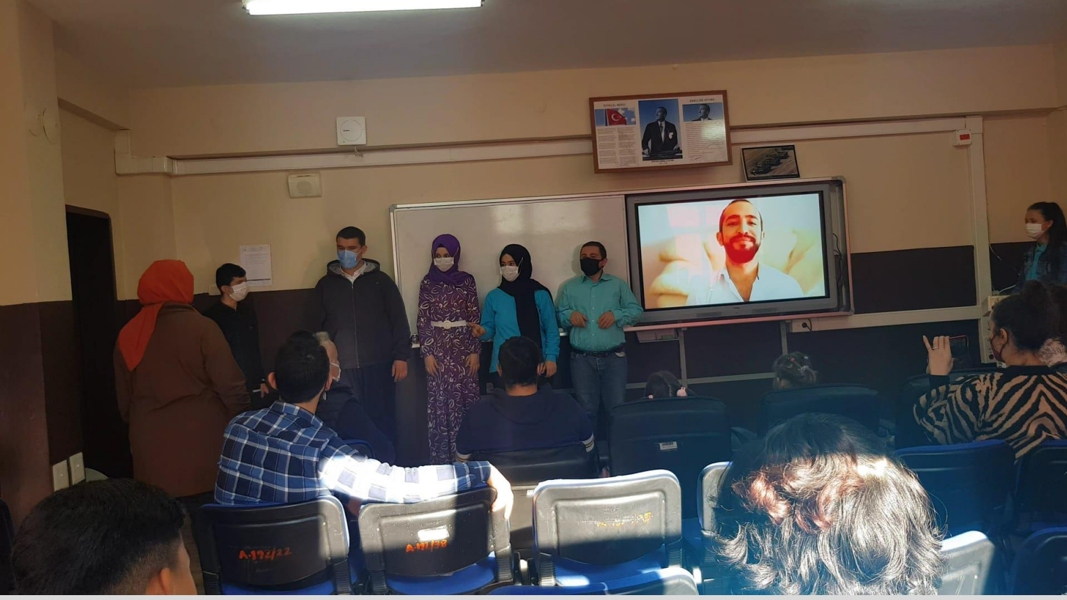
Özen ÖZKAYNAK kaleme aldı.

Dünya Engelliler Günü 1992 yılından bu yana 3 Aralık günü Birleşmiş Milletler tarafından uluslararası bir gün olarak kabul edilmiştir. Ülkemizde de çeşitli etkinlikler düzenlenerek eğitim, sağlık, çalışma hayatı gibi alanlarda fırsat eşitliği sağlanması ve farklılıklara saygı gösterilmesi, mekânsal erişim yanında teknoloji ve bilgiye erişimin bu bireyler için ne kadar önemli olduğuna dikkat çekilerek toplumsal farkındalık oluşturulması amaçlanmıştır.