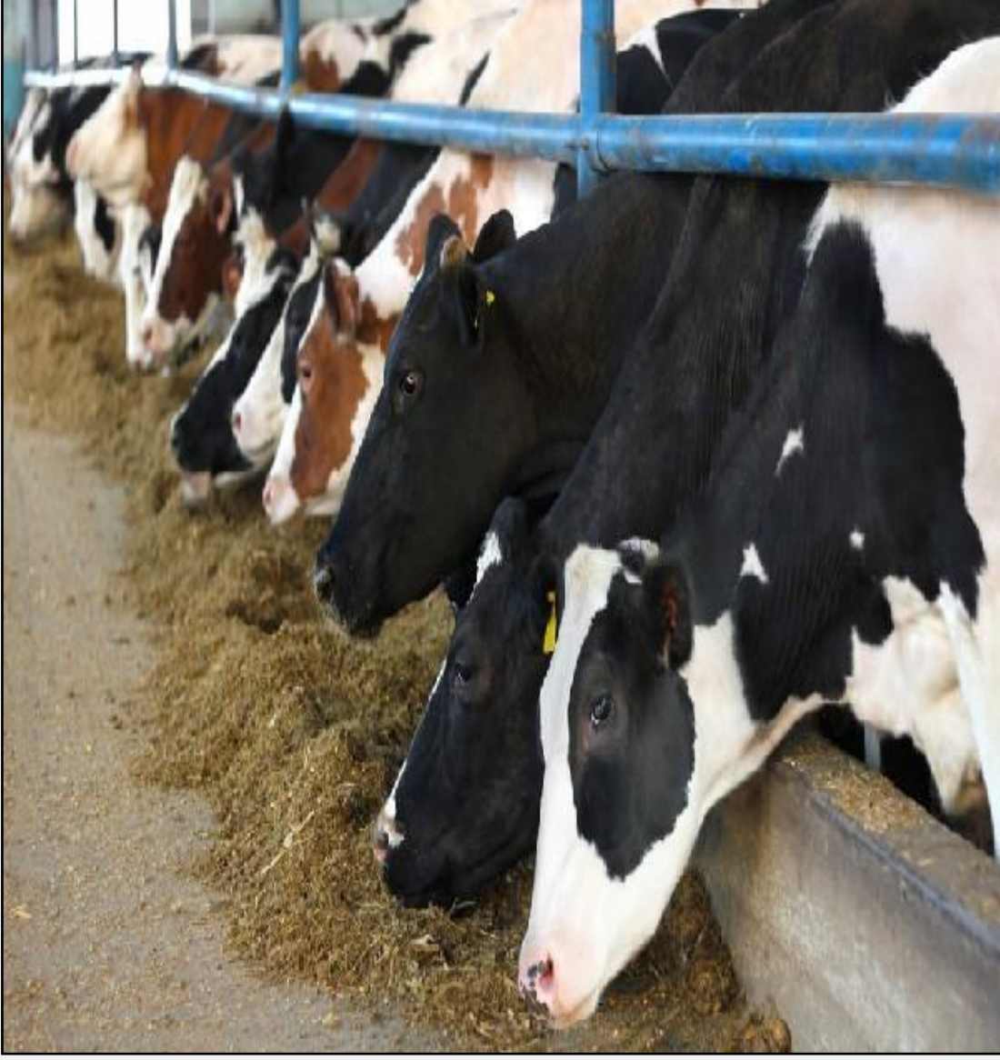
Hayvan Sağlığı ve Yetiştiriciliği Alanı Açılıyor.