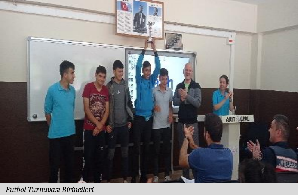
Futbol Turnuvası Birincileri